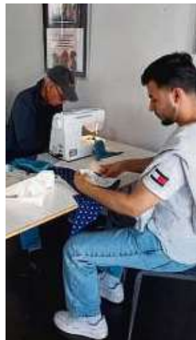
Viele Wimpel bastelten die Flüchtlinge.

„Wir afghanischen Flüchtlinge verurteilen den Messerangriff in Mannheim aufs Schärfste. Solche Gewalttaten schaden nicht nur den Opfern, sondern auch dem Ansehen friedlicher Afghanen weltweit. Wir müssen gemeinsam gegen Extremismus und Gewalt vorgehen. Die Mehrheit der Afghanen sucht ein friedliches Leben und lehnt solche Taten ab. Lassen Sie uns für eine Welt eintreten, in der Respekt und Toleranz herrschen“, formulieren Geflüchtete aus Seligenstadt. Nach dem Attentat in Mannheim, bei dem ein afghanischer Flüchtling einen