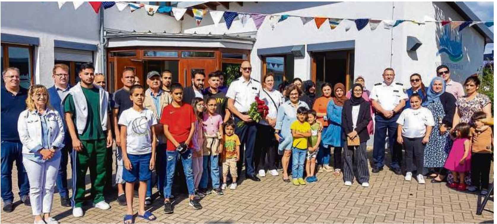
Wimpelkette über dem Nachbarschaftshaus: „Wir stehen fest an der Seite von Vielfalt, Gleichheit und Gerechtigkeit“.