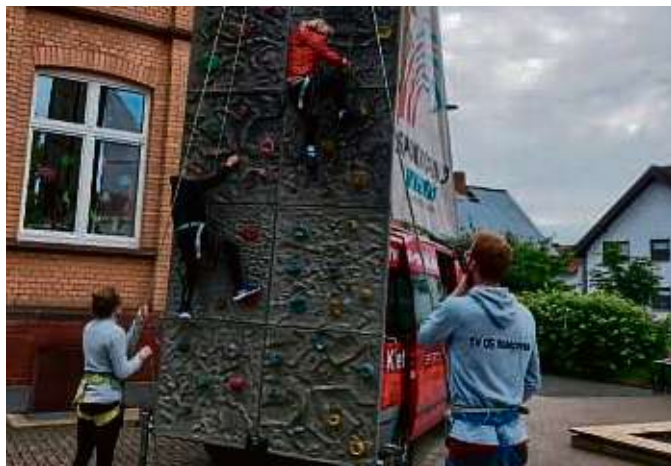
Eine von 30 Stationen: die Kletterwand.

Hainstadt – Ein großes Sportfest feierte die Hainstädter Johannes-Gutenberg-Schule auf dem Gelände der Stammschule. Schon zeitig trafen sich viele Eltern und Helfer, um das Fest vorzubereiten. Unterstützt durch die Sportjugend Hessen und gefördert vom Ministerium für Familie, Gesundheit, Sport, Senioren und Pflege erlebten die Schüler dann einen abwechslungsreichen Vormittag an 30 verschiedenen sportlichen Stationen, sowie ein Fußball-Turnier für die vierten Klassen. Die Schüler konnten sich nach einem gemeinsamen Bewegungsbeginn nicht nur in individuellen Wettkämpfen messen, sondern hatten als Klassen auch Teamaufgaben zu erfüllen, die die Klassengemeinschaft stärkten. Sechs Teamspiele entführten die Schulklassen in Fantasiewelten. So musste ein Laserlabyrinth überstanden, ein Exitroom bewältigt und der gefährliche Schokofluss überwunden werden. Unterstützt von Eltern, die eine Station oder Riege be-