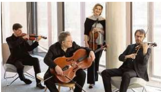
„Künstlerischer Gastgeber“ des kleinen Streicherfestivals der Klosterkonzerte ist seit vielen Jahren das Münchner Henschel-Quartett.