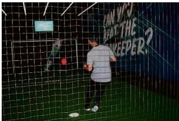
Fußballfans versuchen, gegen den Robokeeper Tore zu schießen. Auch Star-Fußballspieler Lionel Messi hat schon auf den androiden Torhüter geschossen.