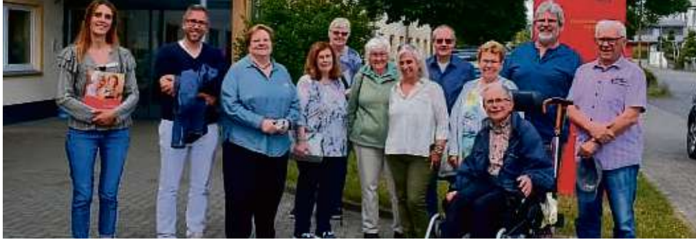
Seniorenbeiratsbesuch im Seniorenheim Kursana-Domizil: Wichtig sind regelmäßige Besuche bei einsamen Heimbewohnern, die keine oder nur wenige Kontakte haben.

Ein weiterer Themenbereich war das ehrenamtliche Engagement von Privatpersonen im Heim. Exakt dazu entwickelte sich eine intensive Debatte mit dem Ziel, zu klären, wie und ob der Seniorenbeirat helfen könne. Die Mit-